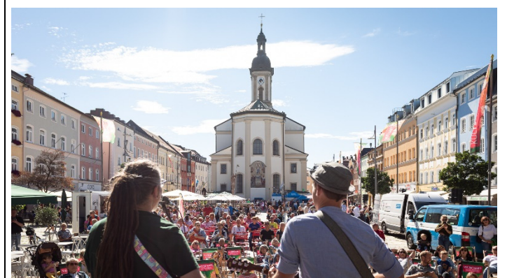
Der Kultsommer beginnt wieder: Auftakt ist am Dienstag, 25. Juni, um 19 Uhr auf dem Stadtplatz.

Die Italienische Nacht am 27. Juli startet bereits um 14.30 Uhr mit dem Eintreffen der Vespa-Fahrer am Stadtplatz. Nach einer Fahrzeugweihe beginnt um 15 Uhr die Ausfahrt, bevor die italienischen Flitzer um 16.30 Uhr zurückerwartet werden. Die Live-Musik beginnt um 17 Uhr, dazu gibt es Genüsse und Kulinarik aus dem Süden.