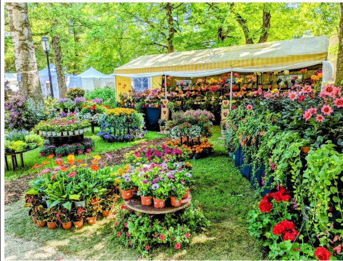
Impressionen von den Traunsteiner Rosentagen der vergangenen Jahre

Alle Informationen zu den 12. Traunsteiner Rosentagen sind auf der Website www.traunsteiner-rosentage.de abrufbar. Veranstalter der Traunsteiner Rosentage ist die Traunstein erleben GmbH zusammen mit der Großen Kreisstadt Traunstein und der Stadtmarketing Traunstein GmbH.