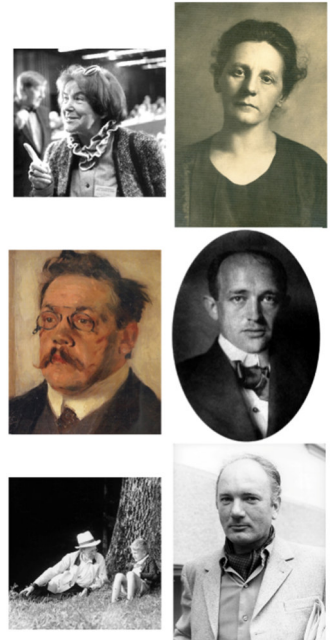
L. Rinser

Anmeldung erforderlich. Unkostenbeitrag 5 Euro. Treffpunkt Eingang Stadtbücherei