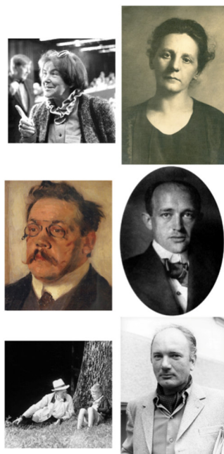
L. Rinser

Anmeldung erforderlich. Unkostenbeitrag 5 Euro. Treffpunkt Eingang Stadtbücherei