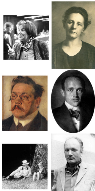
L. Rinser

Anmeldung erforderlich. Unkostenbeitrag 5 Euro. Treffpunkt Eingang Stadtbücherei